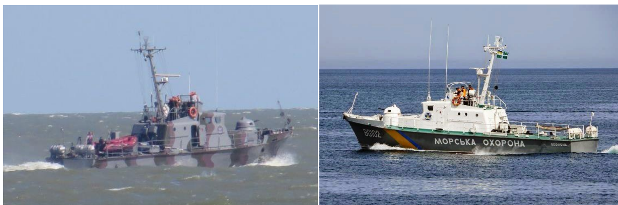
Рис. 3. Катер 1400М «Гриф» Морской охраны Украины

К концу августа 2014 года разрозненные отряды ополчения превратились в вполне боеспособную армию. 24 августа на многотысячном митинге в Донецке глава ДНР Захарченко объявил о начале контрнаступления на южном и северном фронтах. К этому времени диверсионно-разведывательные группы ДНР уже активно действовали в приморских районах. К 28 августа армия ДНР взяла под свой контроль участок побережья Азовского моря от российской границы до восточных пригородов Мариуполя.