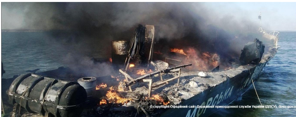
Рис. 5. Горит BG 119