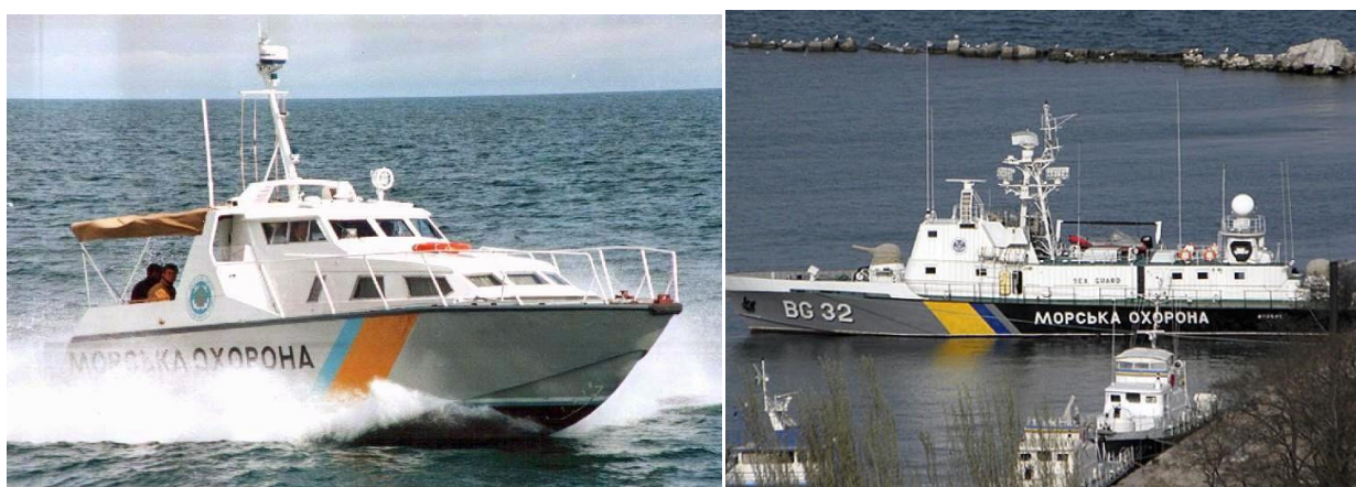
Рис. 4. МКаМО типа «Калкан» (слева) и ВГ 32 «Донбасс» (справа)

Обладание противоборствующими сторонами участками морского побережья поставило их перед необходимостью обеспечения безопасности своих приморских флангов. Уже 31 августа первые потери понесла на Азовском море украинская «Морська Охорона» (морская погранохрана). В районе населенного пункта Безымянное, контролируемого ДНР, огнем с берега на расстоянии 3 мили были потоплены два сторожевых катера, входивших в состав тактической группы морской охраны – ВГ 119 проекта 1400М «Гриф» и МКаМО (малый катер морской охраны) проекта 50030 «Калкан». После этого инцидента командование Охороны «не рекомендовало» своим кораблям пересекать линию разграничения с ДНР.