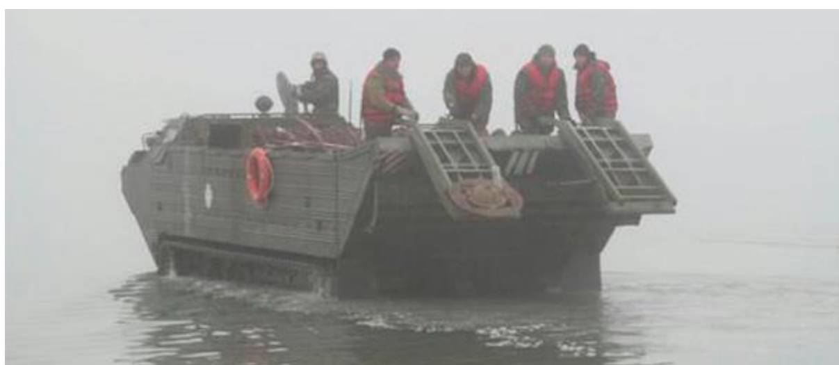
Рис. 6. Постановка мин ПДМ-1М украинскими инженерными войсками (декабрь 2014)