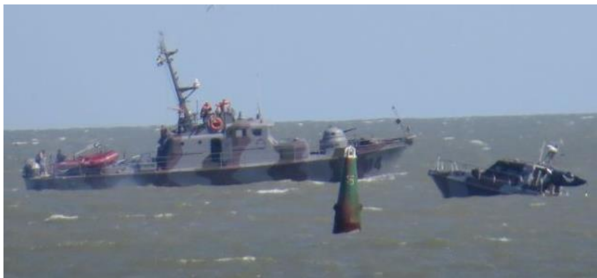
Рис. 7. BG 22, взорвавшийся на mine