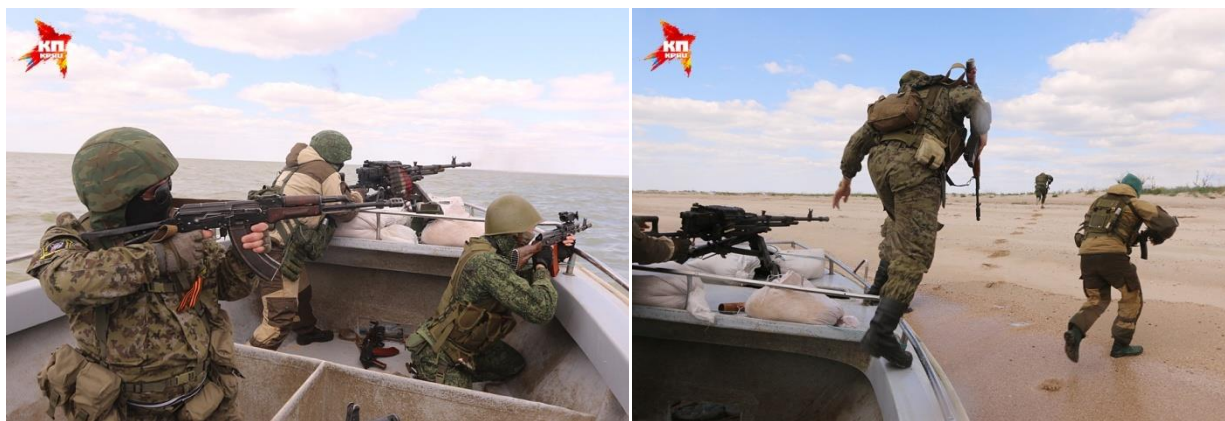
Рис. 9. Учения спецназа «Тайфун» – высадка на вражеский берег

Несмотря на Второе минское соглашение о мирном урегулировании конфликта, украинские власти уделяют особое внимание противодесантной обороне города Мариуполя. Ведь потеря этого крупного промышленного центра нанесет непоправимый удар по всей украинской экономике. Металлургические заводы города являются единственными поставщиками судостроительной и броневого стали на Украине.