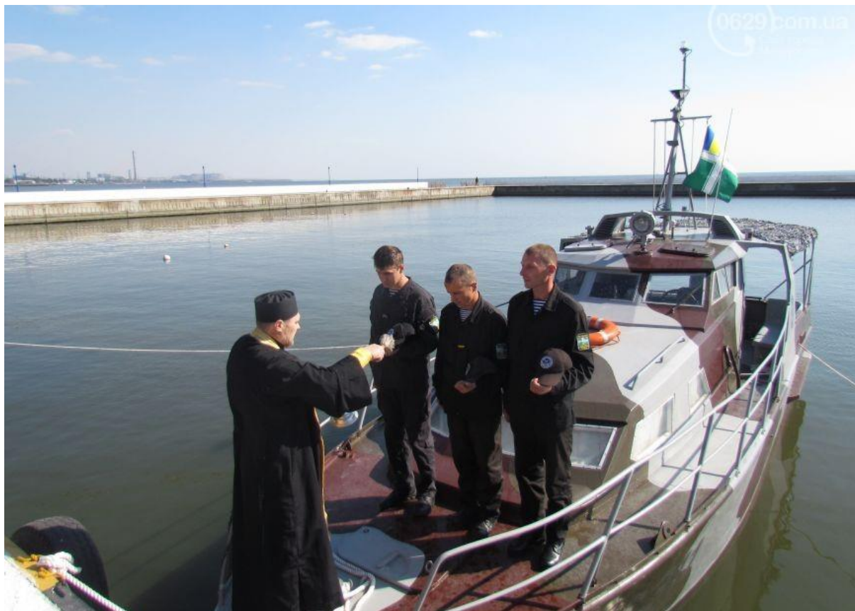
Рис. 2. Крещение нового катера «Калкан» 23-го отряда (октябрь 2015)

го ополчения Донецкой и Луганской республик удалось прочно закрепиться в центральной густонаселенной части Донбасса и в течение лета отражать атаки противника. Однако, пользуясь малочисленностью и неорганизованностью бойцов ополчения на начальном этапе конфликта, украинским силовым структурам удалось взять под свой контроль значительные районы Донбасса, включая побережье Азовского моря с важнейшим портом и промышленным центром Мариуполем (13 июня).