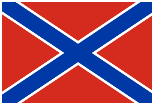
Рис. 1. Эмблема Морской охраны Украины (слева) и боевой флаг Новороссии (справа)

2 мая киевские власти начали широкомасштабную операцию на востоке Украины, официально именованную «АТО» («Антитеррористическая операция», указ исполняющего обязанности президента А. Турчинова об ее начале вступил в силу 14 апреля). Несмотря на подавляющее превосходство сил «АТО» в численности и вооружениях, отрядам народно-