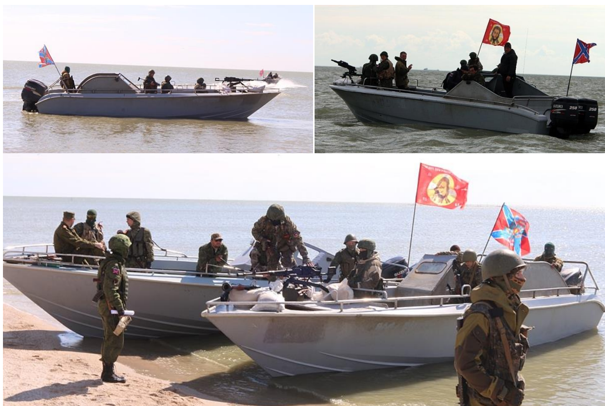
Рис. 8. Катера спецназа ДНР «Тайфун»

На снимках показаны быстроходные катера спецназа «Тайфун» с подвесными моторами «Suzuki» мощностью 500 л.с., вооруженные автоматическим станковым гранатометом калибра 30-мм АГС-17М «Пламя» (прицельная дальность стрельбы 1700 метров, темп стрельбы 470-520 выстрелов/мин) и 12,7-мм пулеметом НСВ «Утес» (прицельная дальность стрельбы 2000 м, темп стрельбы 700 выст./мин).