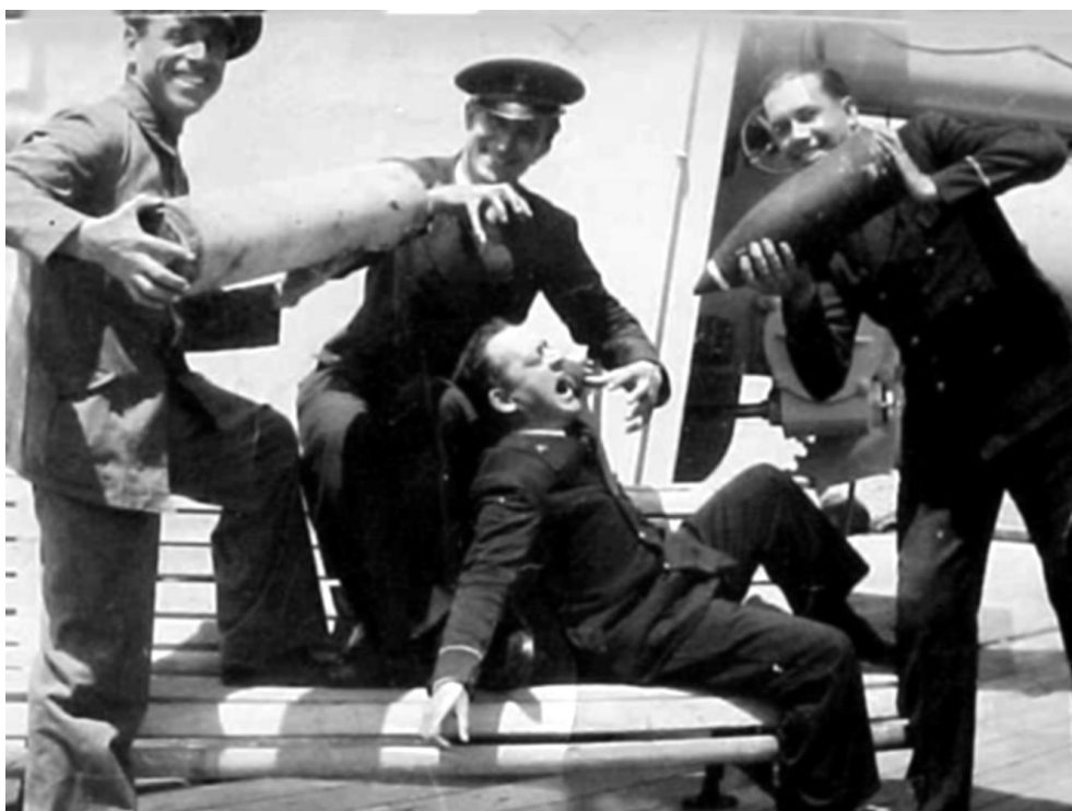
Рис. 2. Постановочная сцена у щита 152-мм орудия. В руках матросов – практически снаряд и заряд. Два человека справа имеют шевроны старшего матроса второй статьи (Cabo Secundo). Во время гражданской войны во флоте республиканцев над шевронами пришивалась желтая пятиконечная звезда. Три человека в зимней повседневной форме одежды, один слева – в рабочей