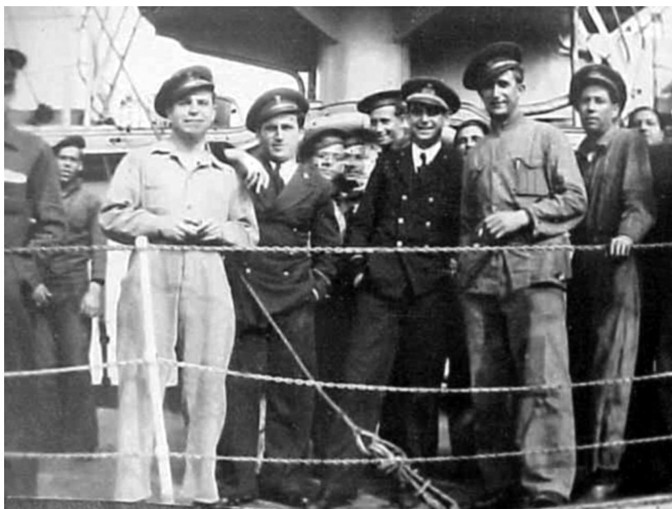
Рис. 8. Персонажи в полном комплекте зимней формы: в центре лейтенант, слева от него – старшина, оба в повседневной форме, остальные – в рабочей форме. На заднем плане носовой мостик, фотограф находится на крыше боевой рубки