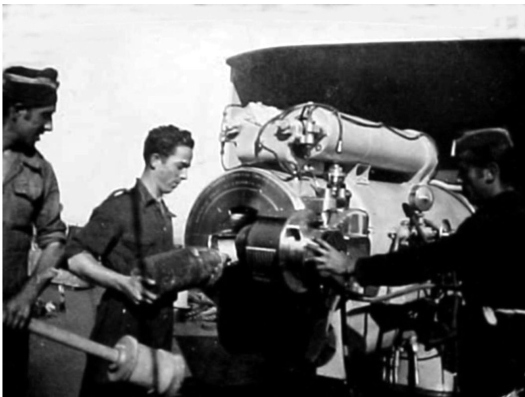
Рис. 9. Тренировка расчета 152-мм орудия. Человек в центре производит зарядание снаряда, слева – готов его досылать, человек справа – открывает затвор