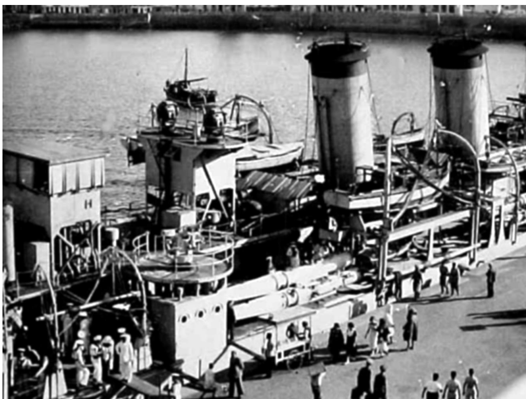
Рис. 10. Вид на центральную часть крейсера «Méndez Núñez». Хорошо видны прожекторные платформы и платформы с 47-мм зенитными пушками. Под ними – трехтрубный торпедный аппарат, центральная труба поднята над крайними