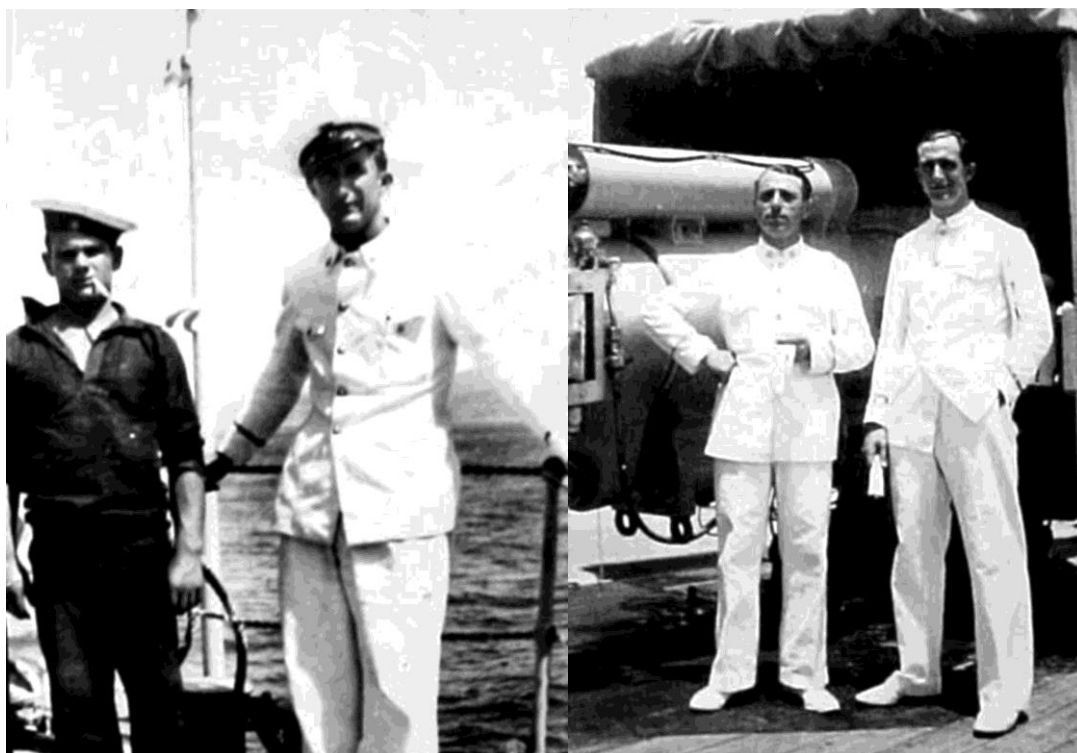
Рис. 6. Слева: унтер-офицер в летней повседневной форме (справа), рядом с ним матрос в рабочей форме (слева), как правило, при этом носилась представленная на снимке фуражка с серым околышем и белой тульей. Справа: два унтер-офицера в летней повседневной форме на фоне 152-мм орудия. Унтер-офицеры и офицеры носили представленные на снимке белые ботинки, матросы – черные