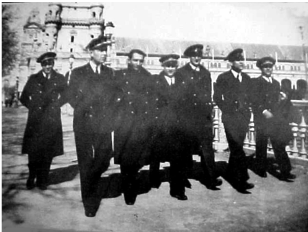
Рис. 5. Группа унтер-офицеров в повседневной зимней форме. На некоторых форменный морской плащ. У некоторых людей видны шевроны со знаками отличия, все они – унтер-офицеры