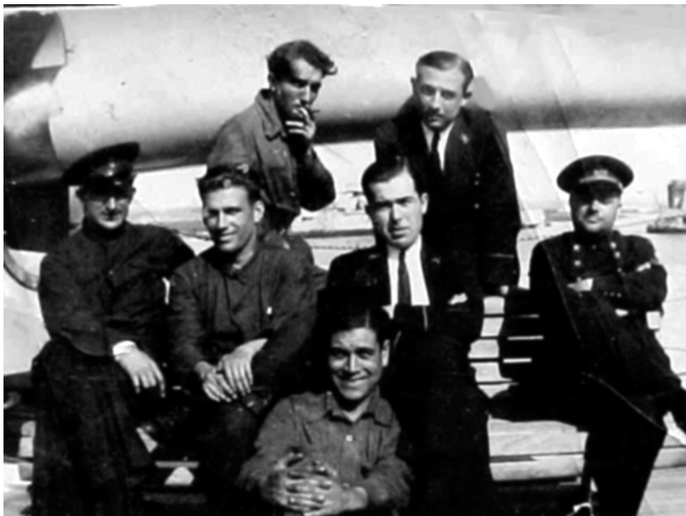
Рис. 1. Группа людей вблизи 152-мм орудия. Двое в гражданской одежде, трое в рабочей, два человека в фуражках – в повседневной зимней форме. На фото невидны знаков различия, все они люди, судя по одежде – матросы и унтер-офицеры