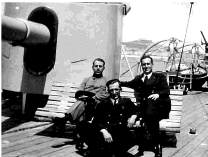
Рис. 4. Фото с кормовым 152-мм орудием левого борта. На заднем плане справа видна платформа с 47-мм зенитным орудием. Три человека в унтер-офицерской форме: один в рабочей и двое в зимней повседневной