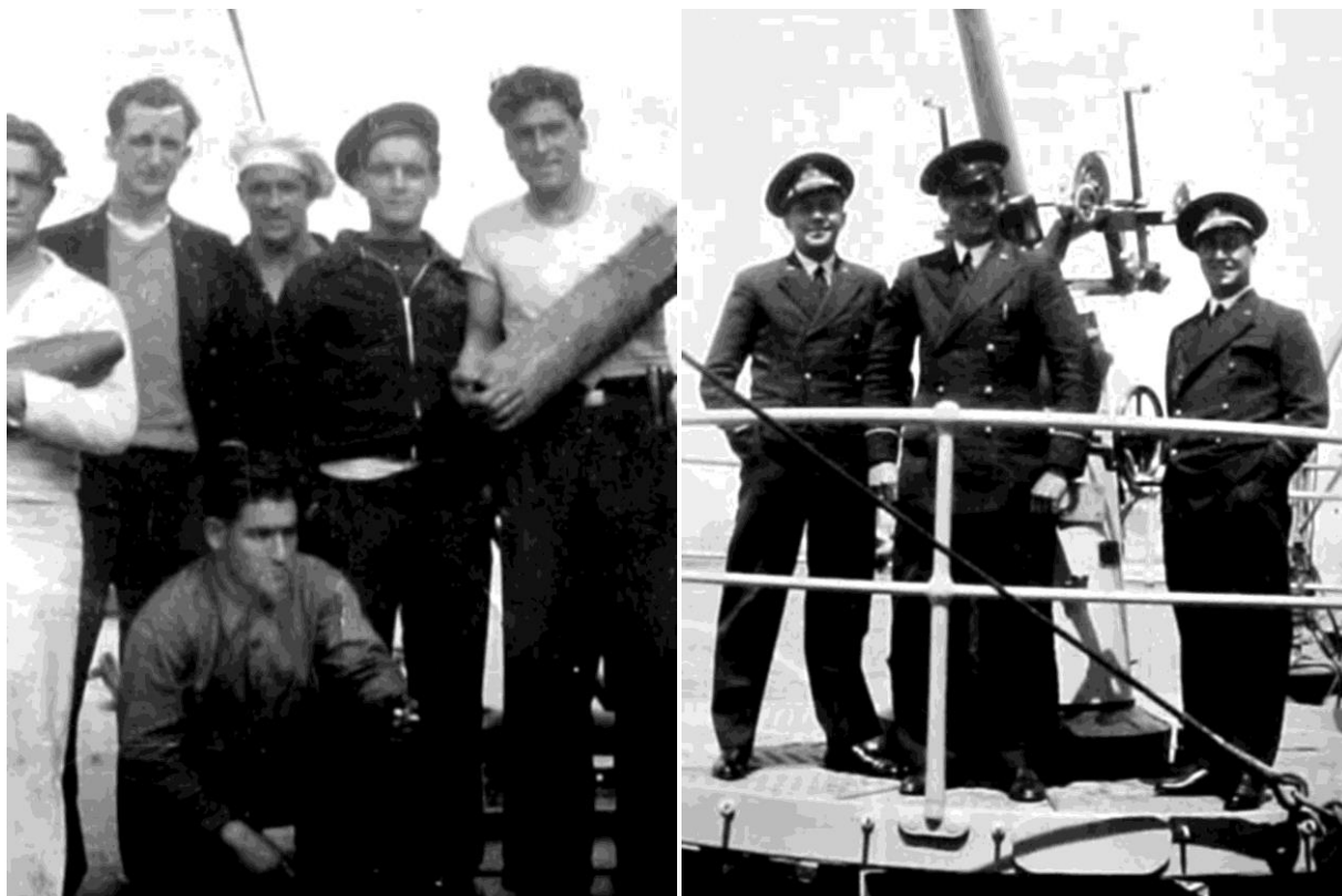
Рис. 3. Слева: повседневная сцена, все персонажи в неуставной форме одежды, в руках крайних – практически снаряд и заряд 152-мм орудия. Справа: платформа 47-мм зенитного орудия, все трое людей в повседневной зимней форме, у человек в центре видны шевроны старшего матроса второй статьи (Cabo Secundo)