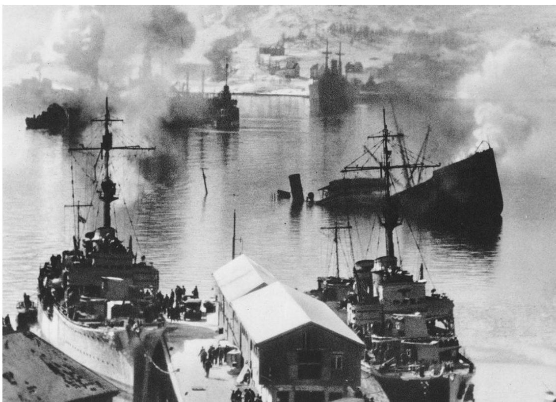
Немецкие корабли в Осло-фьорде (апрель 1940 г.)

Вот что писал о мотивации проведения такой операции и об ее возможных рисках со стороны Кригсмарине гросс-адмирал Карл Дениц: "Отношение флота (немецкого) к политике, которая производилась в отношении Норвегии, было основано на осуждении того, что нейтралитет Норвегии будет самым счастливым решением, если только норвежские территориальные воды будут также не нарушаться противником. Причина такого мнения состояла в том, что считалось почти невозможным защитить свое судоходство (немецкое) в прибрежных водах Норвегии эффективно с имеющимися силами в распоряжении флота, поскольку для английского флота, действующего со своих баз, будет легко препятствовать судоходству (немецкому) в нужных точках в любое время. С другой стороны, все возможные средства должны были бы использоваться, что бы препятствовать тому, что бы Норвегия попала в английскую зону влияния, поскольку это приведет к блокированию Северного моря (англичанами) и будет представлять угрозу для входа в Балтику.