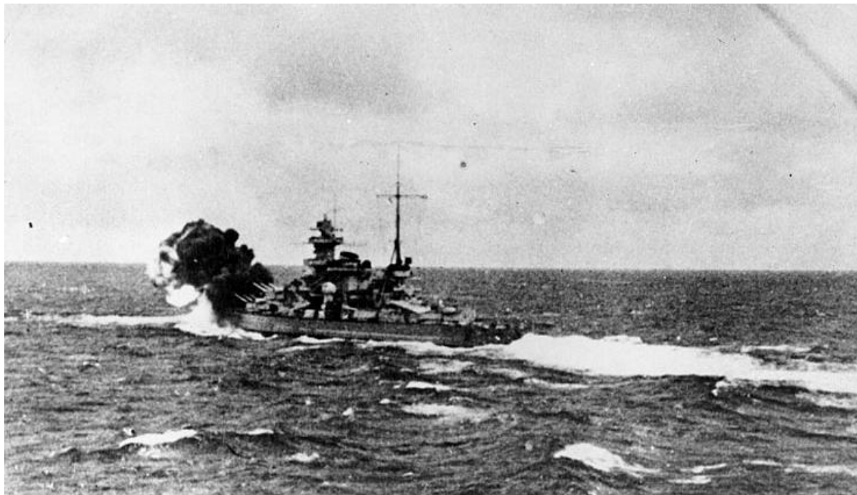
Линкор "Шарнхорст" ведет огонь по авианосцу "Глорис" (8 июня 1940 г.)

ее оборону от возможных попыток вторжения союзников в течении всей войны. На 1 мая 1945 года, согласно докладу командующего силами Вермахта в Норвегии генерала Бёме главе нового правительства Рейха Карлу Деницу, на территории этой страны находилось 11 дивизий и 5 бригад, включая и соединения выведенные из Финляндии. Как докладывал Беме – большинство из этих подразделений боевого опыта не имели, что дает понять о масштабах безопасности, принятых немцами для обороны Норвегии.