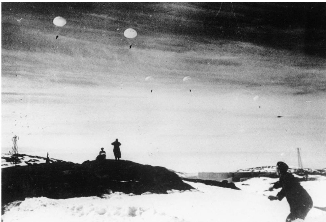
Немецкие парашютисты высаживаются в Норвегии (апрель 1940 г.)

против Франции и продолжит "странную войну" дальше. Для немцев обладание Норвегией означало не только нейтрализацию угрозы, перечисленного выше, со стороны противника, но и получение новых стратегических баз для флота и авиации, которые позволяли бы расширить диапазон действия кораблей и самолетов, а также создавали угрозы союзному судоходству в Арктике и вело к прерыванию морского сообщения между Англией и СССР.