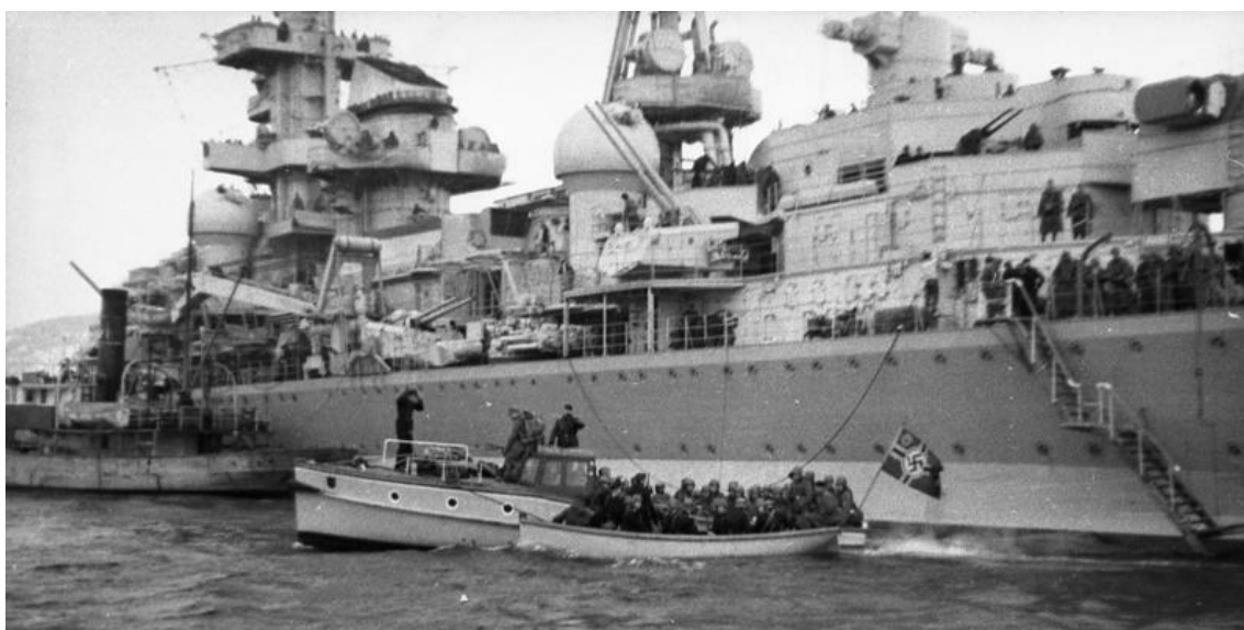
Высадка немецких войск с крейсера "Хиппер" в Норвегии (апрель 1940 г.)

Это привело союзников к разработке планов операций "Вилфред" и "R4", предусматривавших минирование норвежских вод и высадку войск в ключевых портах Норвегии. Немцы ответили разработкой плана "Везерюбунг", который предусматривал действие на опережение планов союзников по оккупации Норвегии. Таким образом, противники вступили в гонку, где призом была эта скандинавская страна.