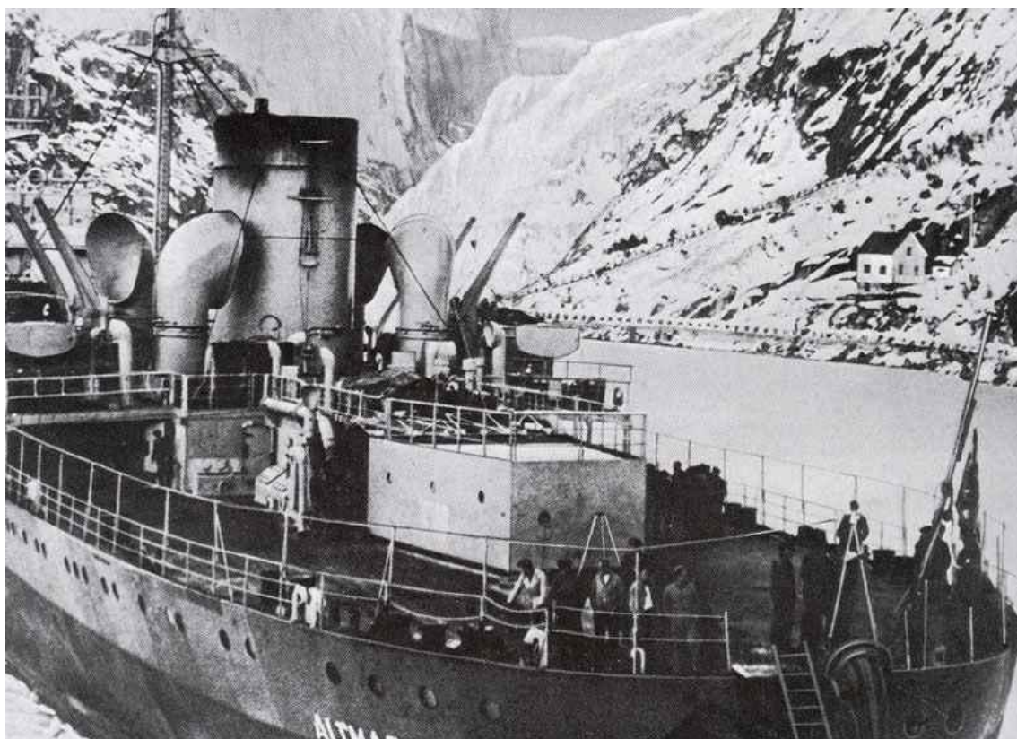
Немецкий танкер "Альмарк", захваченный британским эсминцем "Косак" в норвежских водах

Каково же значение успеха Германии в Норвежской кампании и как оно дальнейшем повлияло на войну?