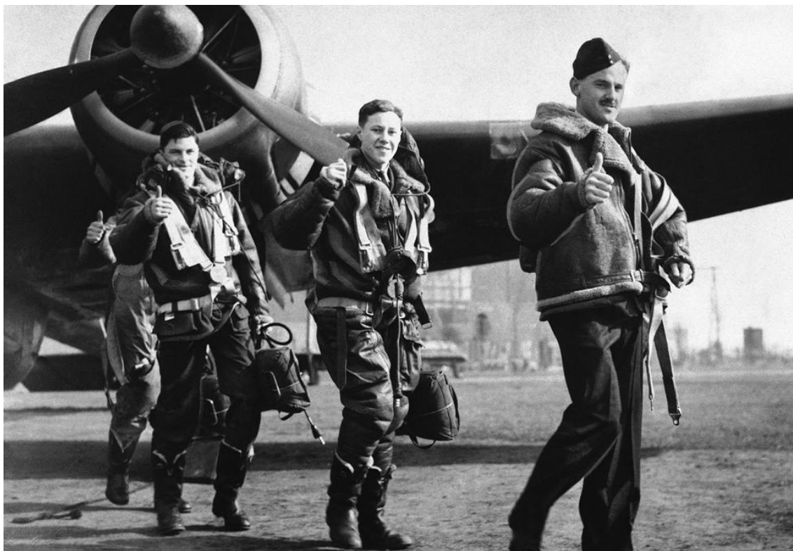
Британские пилоты, вернувшиеся из вылета, в котором они бомбили немецкие корабли в Бергене (апрель 1940 г.)

Арктике против союзного и советского судоходства на протяжении четырех лет. После падения Франции, Норвегия стала основным местом базирования немецких подводных лодок, оставаясь им до конца войны. Поэтому можно с полной уверенностью сказать, что захват Норвегии являлся одной из причин, повлиявших на потопление миллионов тонн торгового тоннажа союзников.