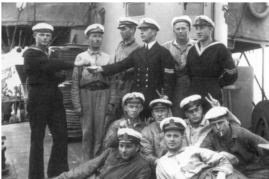
Группа матросов на палубе "Вамболы". Большинство – йоссы