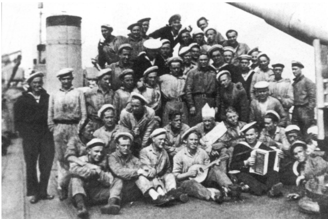
Конкурс "Мисс Леннук". Традиционно этого титула удостоивались матросы с самым скверным характером