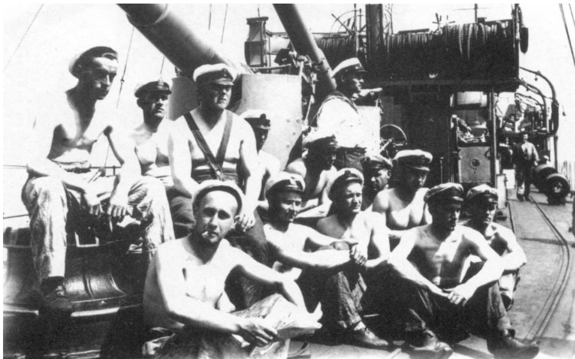
Момент летнего отдыха под кормовыми орудиями. Большинство матросов – йоссы

В рассматриваемый период действительная служба на флоте продолжалась полтора года. После того, как 20-летний новобранец вливался в корабельный экипаж, его положение в неуставной иерархии называлось "йосс" ("joss"). После прибытия новой партии призывников, бывшие "йоссы" становились "вяна кала" ("vana kala" – эст. "старая рыба").