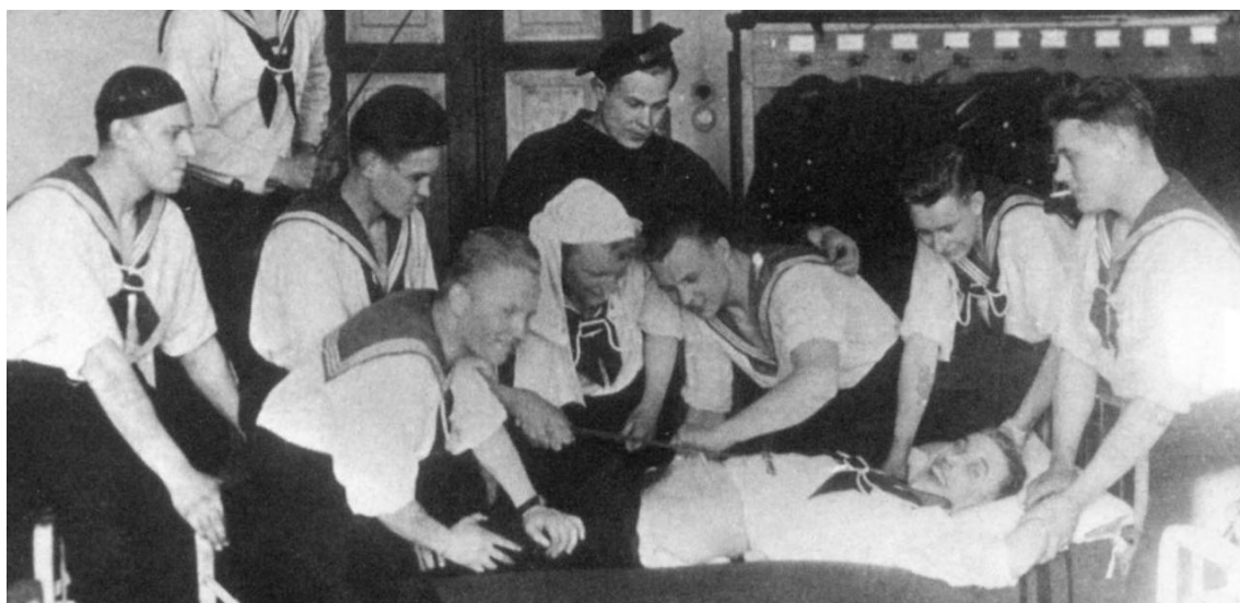
Обрезание, запрещенное в эстонском флоте, но проводившееся тайком [4]

Исторический аспект неуставных взаимоотношений в российской армии в последнее время все больше привлекает внимание историков [1, 2]. Вполне очевидно, что можно говорить о формировании целой "неуставной субкультуры". Однако хронологические рамки указанных исследований ограничиваются либо концом XIX – началом XX вв. [1], либо второй половиной XX в [2]. Исходя из анализа доступной литературы, можно утверждать, что первая половина XX в. пока целенаправленно не исследовалась, тем более положение дел в государствах-лимитрофах.