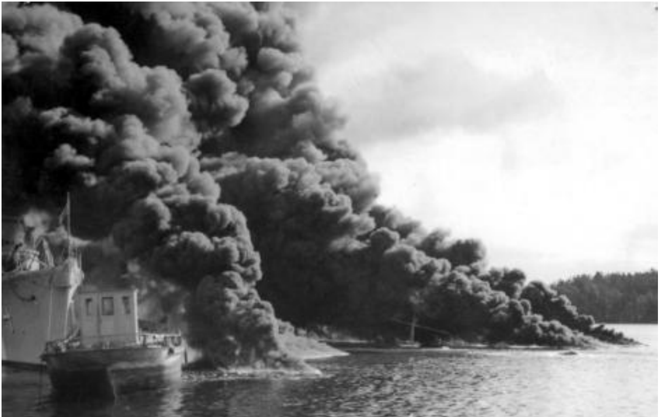
Трагедия в Хоршфярдене: "Клас Хорн" и "Гетеборг" затонули, "Клас Уггла" още на плаву