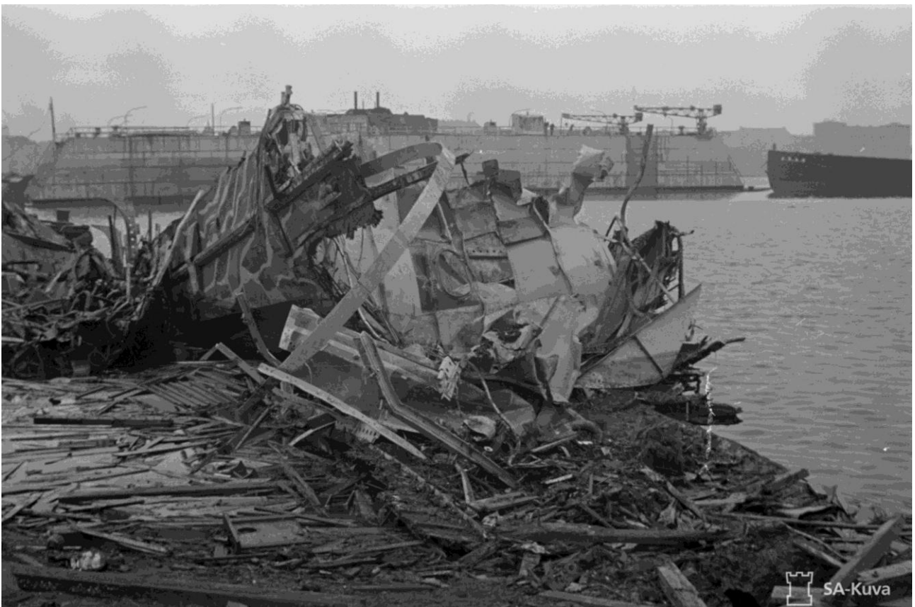
Германские "Раумботы" R-60, R-61 и R-62 после проведенной диверсии