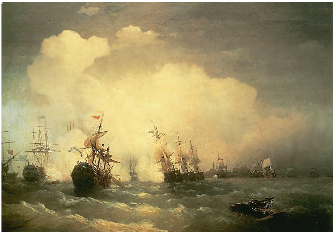
Морское сражение при Ревеле 2 мая 1790 г. (картина И.К. Айвазовского, 1846 г.)

Шведы находились на Роченсальмском рейде, отлично защищенной позиции, куда был проход с юга между островами Муссола и Кутиала, шириною 400 сажений, а с севера более узкий, называемый Королевскими воротами. Оба прохода были защищены батареями. Кроме того Королевские ворота были преграждены затопленными судами.