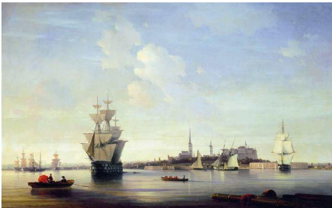
Ревель, 1844 г. (картина И.К. Айвазовского)

В эпоху Петра I и до правления Екатерины II большие галеры с экипажем от 280 до 300 человек, имели куршейную пушку в 18-фн, две боковых, 15 или 18-фн. и 12 3-фн. фальконетов. На малых галерах, с экипажем 200 человек куршейная пушка была 12-фн, а боковые – 8-фн. и 8–10 3-фн. фальконетов. Галеры конные, предназначенные для перевозки кавалерии, по недостатку помещения, вооружались: большие – двумя 12-фн. и десятью 3-фн., а малые двумя 8-фн. пушками и восемью 3-фн. фальконетами.