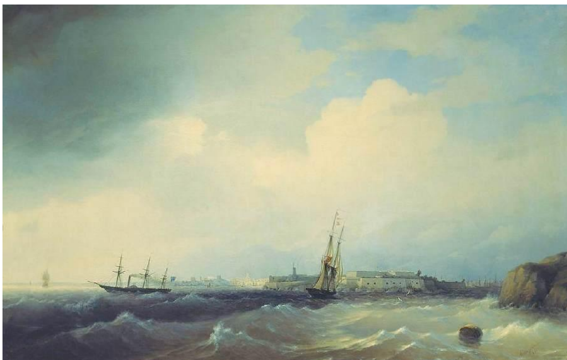
Свеаборг, 1844 г. (картина И.К. Айвазовского)

Качество шведских кораблей было исключительно высоким. Кораблестроитель Чапман создал много удачных кораблей для своего флота, а также новый тип шхерных судов – канонерские лодки [15]. Во времена Павла I по типу захваченных у шведов кораблей "Ретвизан" и "Омгетек" было построено два корабля, а по типу захваченного фрегата "Венус" – четыре [8].