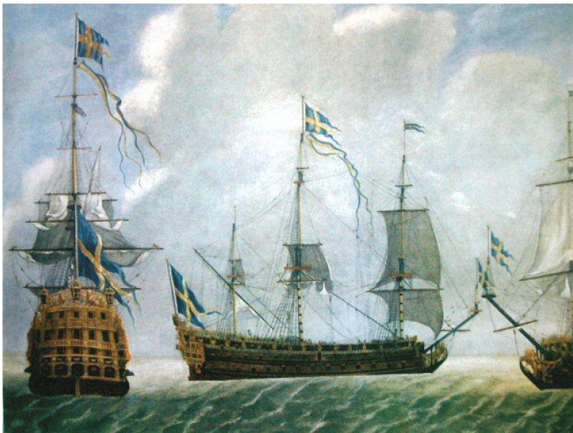
Шведский 110-пушечный корабль «Король Карл»

Боевые действия велись с 4 июня по 14 июля.