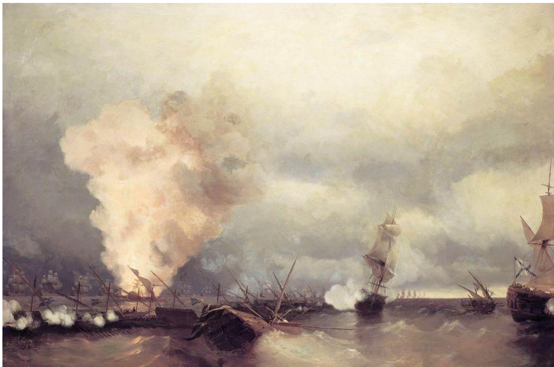
Морское сражение при Выборге 29 июня 1790 г. (картина И.К. Айвазовского, 1846 г.)

Русский Балтийский флот состоял из 29 кораблей, 13 фрегатов и 50 меньших судов; галерный – имел около 200 судов различных типов.