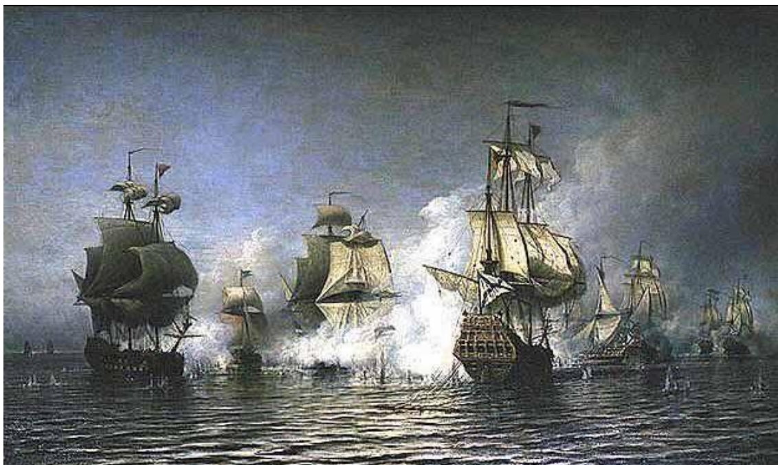
Бой при острове Эзель

В начале войны, то есть к 1700 году Швеция располагала тремя эскадрами, в составе которых было 42 корабля (от 46 до 104 пушек) и 12 фрегатов (от 20 до 36 пушек); на кораблях стояло 2700 орудий; экипажи кораблей насчитывали 13 тыс. человек. Кроме того у Шведов было 800 торговых судов, которые можно было вооружить артиллерией. В Северной войне флот Швеции понес большой урон: часть флота была уничтожена в сражениях, часть погибла во время штормов, некоторые суда сгорели и сгнили [10].