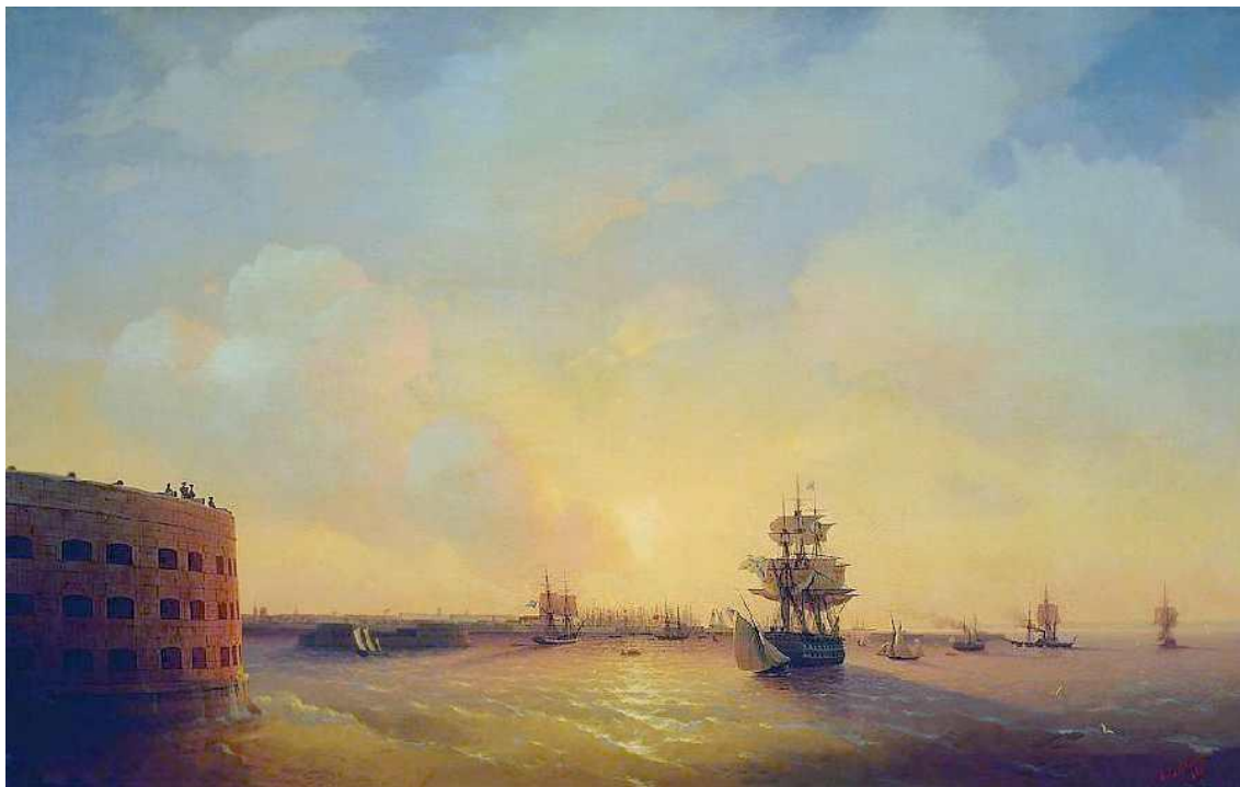
Кронштадт, форт "Император Александр I", 1844 г. (картина И.К. Айвазовского)

С 7 по 9 июня флоты продефилировали мимо друг друга и шведский, наконец, удалился, открыв путь для русского гребного флота [9].